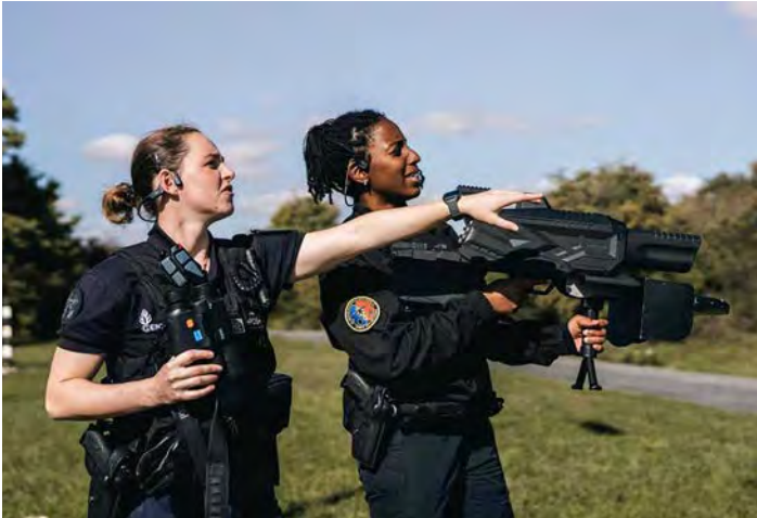
Figure 12 : Lutte anti-drone

En août 2018, plusieurs drones venaient exploser près du président vénézuélien Nicolás Maduro, blessant plusieurs personnes.