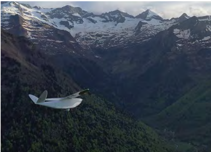
Figure 8: Delair DT26 drone on inspection flight in the Pyrenees

Communities benefit directly from these possibilities. Some municipalities have been able to carry out surveys or mapping campaigns in just a few weeks that would have taken months or even years using conventional methods. Significant savings are generated, particularly for cadastral surveys, identifying maintenance needs and updating land registries.