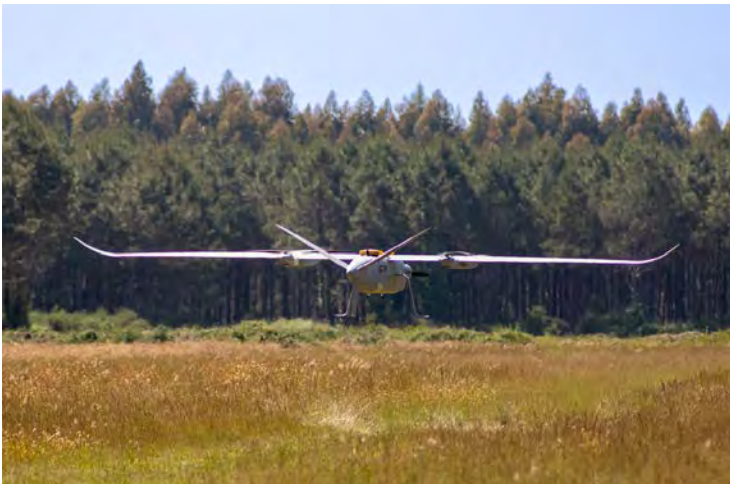
Figure 9: Delair DT61 drone

In addition to emergency response, drones are also being used for a wide range of environmental missions. They can monitor coastal erosion and illegal waste dumps, as well as various forms of pollution. These operations can be carried out more quickly than ever before, and without exposing staff to the dangers of unstable or polluted terrain.