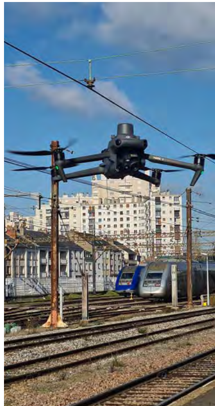
Figure 6: Delair Altametriz Drone

During his presentation to the working group in January 2025, the UAV director of the DGAC gave an overview of the drone operator landscape in France. There are around 145,000 declared operators, most of whom are in the Open category and 20,000 in the Specific category.