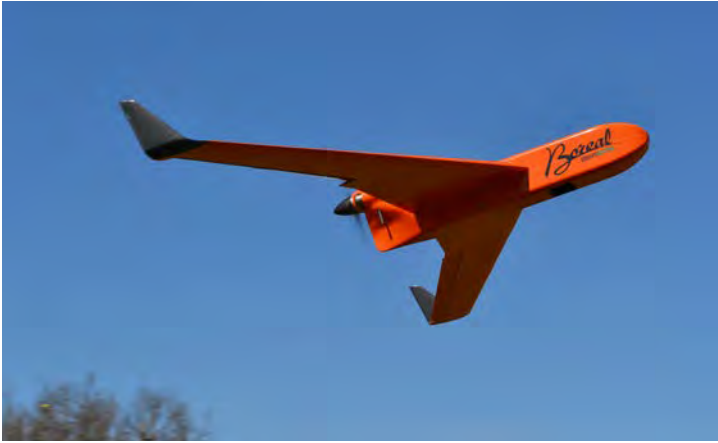
Figure 10 : Drone Boréal

résilientes pour les systèmes de drones et particulièrement le fonctionnement en essaim. Chaque drone est un nœud du réseau et agit comme un récepteur/émetteur de communication, ce qui permet une reconfiguration en cas de perte d'un nœud, sans interruption de la mission.