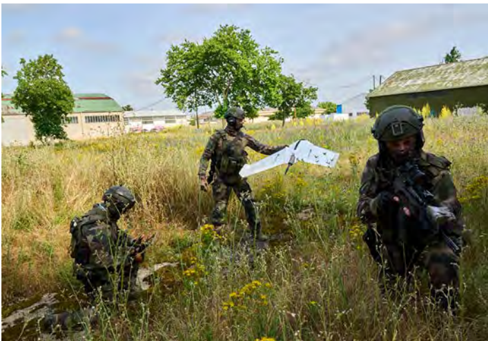
Figure 7: Oskar drone, remotely operated munition

Technological control is becoming increasingly important: who produces them, who exports them and who modifies them? The role of components, software and AI in military drones is set to grow.