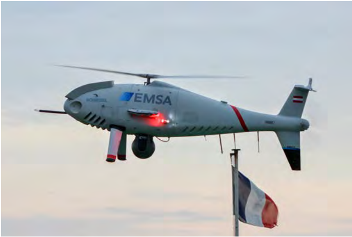
Figure 3: Schiebel drone from the European Maritime Safety Agency, at Cap Gris-Nez