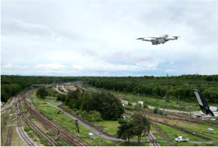
Figure 2 : Drone Delair exploité par Altametris