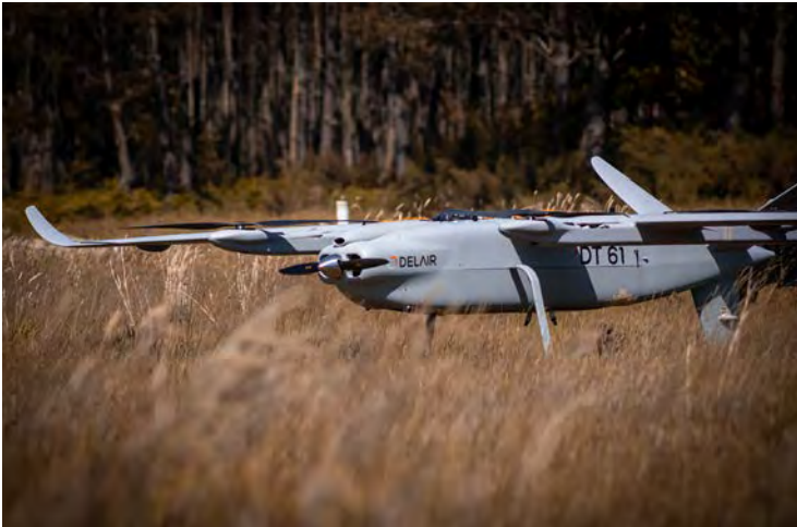
Figure 1: Delair Drone DT61

Following a conference in 2014, the Air and Space Academy (AAE) and the French Aeronautical and Astronautical Association (3AF) published Dossier No. 40 (also referenced as Cahier 14 by 3AF 1 ), "Present and future of civilian drones", in 2015. In view of the technological and regulatory developments over the last decade, these two bodies once again set up a working group in September 2024 to update this work.