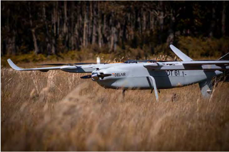
Figure 1 : Drone Delair DT61

À la suite d'un colloque fondateur en 2014, l'Académie de l'air et de l'espace (AAE) et l'Association aéronautique et astronautique de France (3AF) ont publié en 2015 le Dossier n° 40 (également référencé Cahier 14 par la 3AF 1 ), « Présent et futur des drones civils ». Face aux bouleversements technologiques et réglementaires de la dernière décennie, un groupe de travail rassemblant de nouveau ces deux entités a été mis en place en septembre 2024 pour actualiser ces travaux.