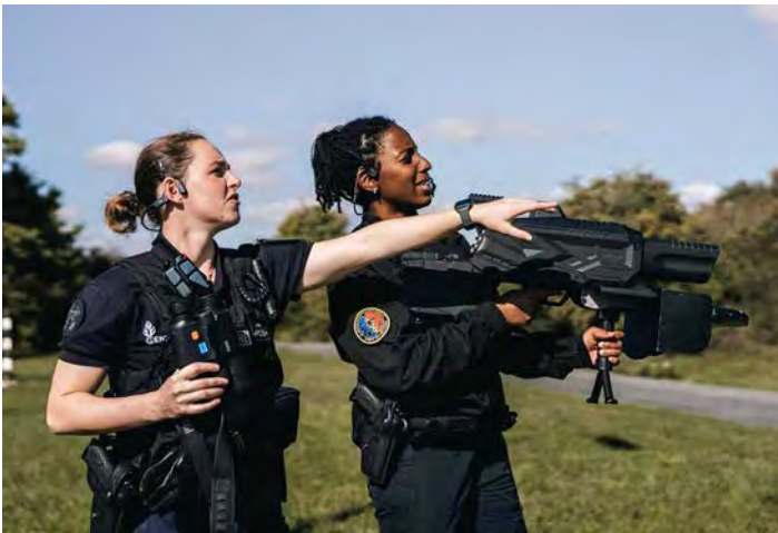
Figure 12: Anti-drone action

In 2025, many European airports fell victim to drone overflights designed to disrupt air traffic. According to the Revue de la défense nationale (RDN) website: "In early October, several unmanned aircraft were spotted in the Bavarian skies, leading to the diversion of around 15 flights from Munich to Stuttgart, Nuremberg, Frankfurt and Vienna airports. In mid-November, seventeen suspicious drone incidents were reported in Belgium in the vicinity of military bases, civilian airports and other strategic sites. The Belgian federal prosecutor's office has opened eight investigations into seventeen incidents involving unidentified drones flying over strategic infrastructure such as airports, military bases and nuclear power stations. On 22 November, air traffic at Eindhoven airport in the Netherlands was interrupted."