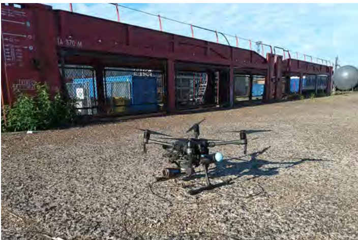
Figure 5: Delair Altametris drone