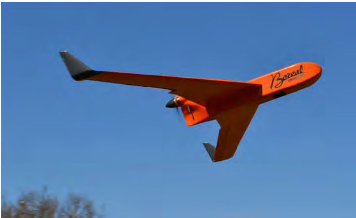
Figure 10: Boréal drone

Another notable development is the use of Manet (Mobile ad-hoc network) links to create a mesh network between ground stations and UAVs. These provide robust, secure and resilient control, command and data-exchange links for UAV systems, particularly those operating in swarms. Each UAV acts as a network node and a communication receiver/transmitter, enabling reconfiguration in the event a node being lost, without interrupting the mission.