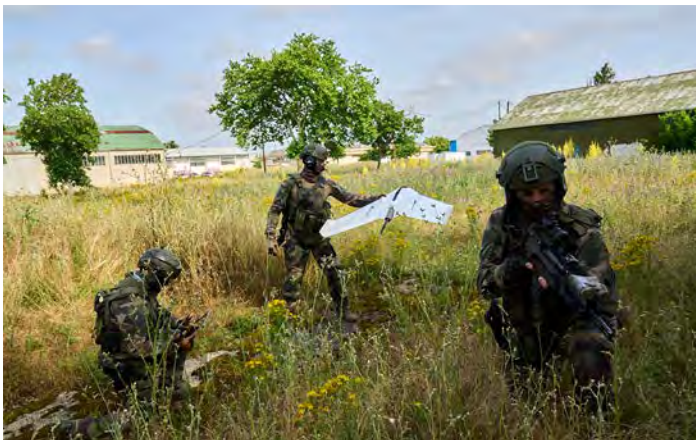
Figure 7 : Drone Oskar, munition téléopérée