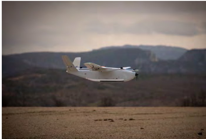
Figure 4: Delair DT46 drone