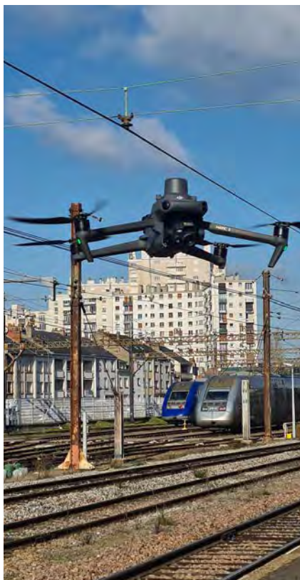
Figure 6 : Drone Delair Altametris

Lors de son intervention devant le groupe de travail, en janvier 2025, le directeur de programme drones de la DGAC a donné un aperçu du paysage des opérateurs de drones en France, avec environ 145 000 opérateurs déclarés, la plupart en catégorie ouverte et 20 000 en catégorie spécifique.