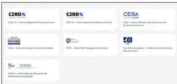
Figure 11: In France, several civil drone test centres have formed an alliance and are working with the DGAC-DSAC's Drone programme department. Some information is available on their website: www.centre-essais-drones.fr .

As the use of civil drones expands, so does the demand for appropriate infrastructure and regulations to support the development, testing, certification and/or approval of drone platforms. A report [16] drawn up by 3AF summarises industrial needs and availability of drone flight test centres in France and abroad, and makes recommendations for improving the situation in France.