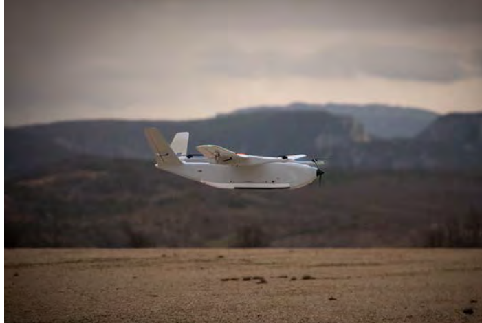
Figure 4 : Drone DT46 Delair