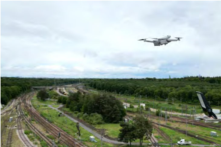
Figure 2: Delair Drone operated by Altametris