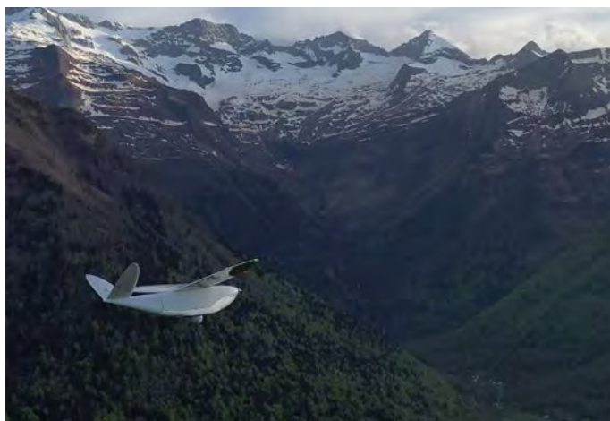
Figure 8 : Drone Delair DT26, inspection dans les Pyrénées

Les drones facilitent l'inspection des infrastructures critiques telles que ponts, réseaux d'utilité publique, bâtiments complexes ou installations industrielles. Grâce à leurs capteurs visuels et thermiques, ils permettent de repérer rapidement les anomalies, de surveiller l'évolution de l'état des structures et de constituer des archives aériennes complètes.